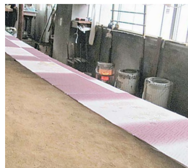
「ぼかし」が出せるのも引染の特徴