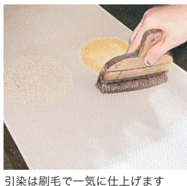
引染は刷毛で一気に仕上げます

柄の部分に色が付かないように糊をのせる「伏せ糊」、染料を均等に浸透させるために大豆のしぼり汁などを塗る「地入れ」を行ってから生地を乾燥させた後、全体に刷毛で