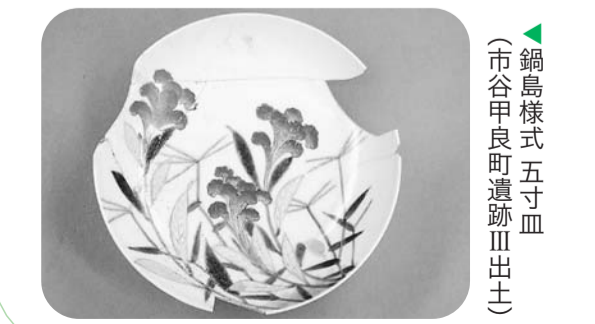
▲鍋島様式五寸皿(市谷甲良町遺跡III出土)

平成19年度以降に発掘調査した成果に加え、遺跡から見る新宿の歴史的特色を紹介しています。 【日時】7月18日(金)～10月2日(日)午前9時30分～午後5時30分(入館は午後5時まで) 8月23日(火)から一部展示替えをします。7月25日・8月8日・22日、9月12日・26日の月曜日は休館 【会場・問合せ】同館(三栄町22) ☎(33359)2131へ。