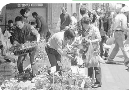
▶土と苗のサービスデー