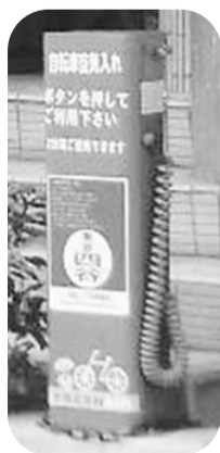
◀商店街に設置している自転車の電動空気ポンプ

江戸の昔、辺りを真っ赤に染めたという内藤とうがらしは、今も四谷のまちに彩りを添えています。