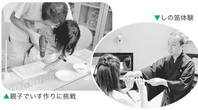
▲親子でいす作りに挑戦

伝統産業や芸術文化を気軽に体験できます。 【日時・会場・対象・内容】下表のとおり。各プログラムの定員は10～30名程度 【費用】100円(保険料等) 【申込み】はがきかファックス(記載例(2面参照)のほかプログラム名・希望日時・年齢・性別、中学生以下の方は保護者氏名を記入)で、10月22日(必着)までに文化観光国際課文化観光国際係(〒160-8484歌舞伎町1-4-1、本庁舎1階) ☎(5273)4069・☎(3209)1500へ。応募者多数の場合は抽選。