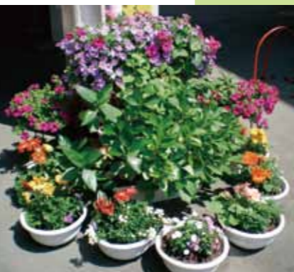
▲鶴巻小学校に植栽した花々

第三分科会では、地域の環境美化の促進を目的に、 ●放置自転車追放 ●タバコとゴミのポイ捨て撲滅 ●緑化活動 の3点を中心に活動しています。4月4日(日)には早大通りで「放置自転車・ポイ捨て禁止」のキャンペーンを行いました。この日はフリーマーケットということもあり、たくさんの方で賑わい、用意していたボールペンとティッシュはあっという間になくなりました。新宿シンちゃんに着ぐるみも登場し、相変わらずの大人気でした。寒い日でしたが、「やめましょう!!ポイ捨て・放置自転車」ののぼりと一緒に練り歩くうちに、着ぐるみの中は湯気が上がるほどの暑さになりました。(中に入ってゆであがった?のは当分科会の委員です。)