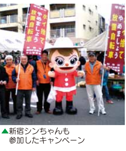
▲新宿シンちゃんも参加したキャンペーン

緑化活動では江戸川小学校に引き続き、早稲田小学校、鶴巻小学校にも花をプレゼントしました。小学校周辺の地域の方々の目にも触れるように花の位置を工夫しました。早稲田小学校はちょうど卒業式に間に合い、多くの方々にご覧いただくことができました。また、鶴巻小学校も新学期早々に花を植え、学校に面した道路から見える色とりどりの春の花が、人々の目を楽しませました。きれいな花を飾ることで道端のゴミが減るなどの期待もしつつ、これからも地区内の小学校に花が絶えないよう、美化・緑化の活動に力を入れていきます。今年江川小学校が一〇周年と記念の年なので、周年行事に合わせて祝典に美しい色を添える花をお贈りします。これからも多くの人に地区協議会を知っていただき、住民の人々と共に活動の輪を広げていけるように、まちの美化を目指して様々な取り組みをしていきたいと思っています。