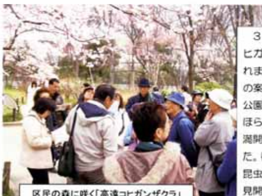
区民の森に咲く「高遠コヒガンザクラ」