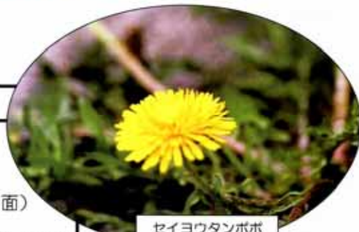
セイヨウタンポポ 2006/5/11撮影