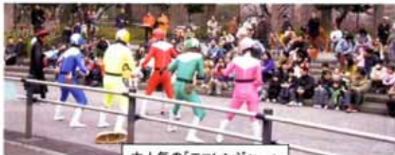
大人気の「エコレンジャー」

今年で3回目を迎えた春まつり。24日は、「作って遊ぼう」「エコレンジャーショー」「プレーパーク」が中心のプログラム。春休みに入った子どもたちが大勢集まって、一日楽しんでいました。25日はあいにくの雨で、中止になりました。しかし、この地域で活躍する多くの団体個人が企画の段階から参加して作り上げたこのまつり。来年はぜひすべてのプログラムが実行できますように！