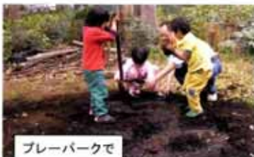
プレーパークで泥んこ遊び！