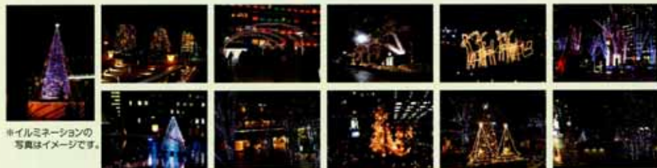
イルミネーションの 写真はイメージです。