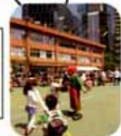
新宿スクエアタワー