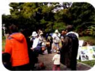
ピオトープの見学