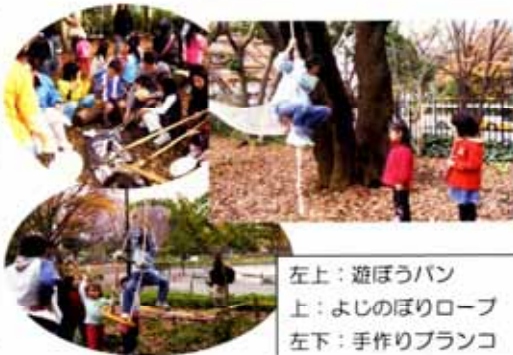
左上:遊ぼうパン 上:よじのぼりロープ 左下:手作りブランコ

秋晴れのさわやかな空気の中、ジャブジャブ池の横で、子ども達の絶叫に似た歓声が響きわたりました。樹木にセットされたハンモック、よじ登りロープ、手作りブランコなど自由な冒険遊びでした。その横では炭火でトン汁、直火パン(遊ぼうパン)、マシュマロ焼きなど、焼くのも食べるのも最高!パパやママと参加の幼児もキャッキョ。楽しい楽しい都会の森のイベントでした。