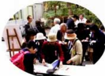
落ち葉をパウチしてしおりづくり