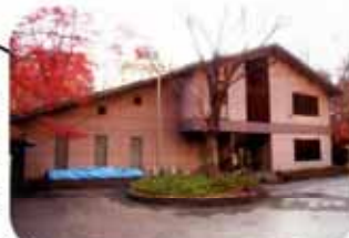
中央公園管理事務所