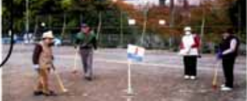
誰でも参加できます。直接会場におこしください。