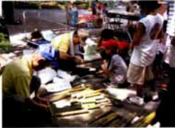
竹筒で「手作り水でっぼう」