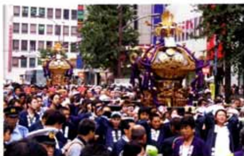
新宿駅西ロータリーに向かう宮神輿

ジャブジャブ池も毎日たくさんのお子様でにぎわっていた今年の夏。暑かったですねー！ 8月19日(土)20日(日)の二日間、昼夜にわたりイベントが行われ、たくさんの方が夏のひとときを楽しみました。昼間はちびっ子広場を中心に、クラフト、パンブーダンスや作って遊ぼう(水でっぼうや風車作り)、一日プレーパーク(あそぼうパン作り)などが実施。夜は水の広場にて、角筈地区青少年育成委員会主催による恒例の盆踊り大会。「子どもが主役の盆踊り」のとおり、児童による「よさこいソーラン」がオープニングで披露されました。外国の方も多く訪れて、写真をたくさん撮っていました。来年の夏もいっぱい遊びましょう！