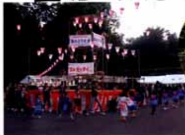
元気に「よさこいソーラン節」