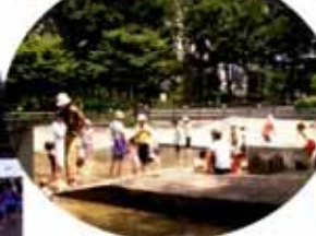
大賑わいのジャブ池