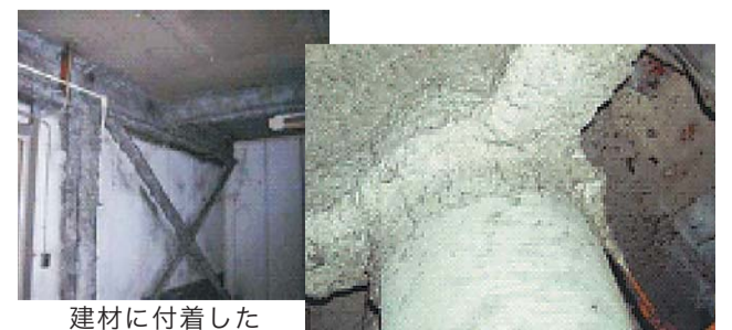
建材に付着したアスベスト

「アスベスト助成の手引き」を建築指導課・特別出張所で配布します。新宿区ホームページでもご案内しています。