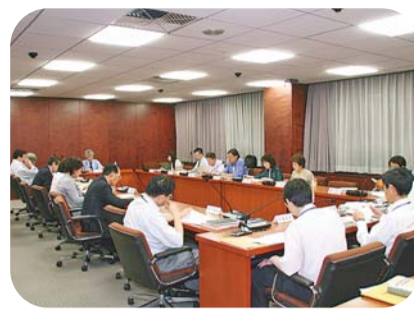
検討連絡会議での意見交換