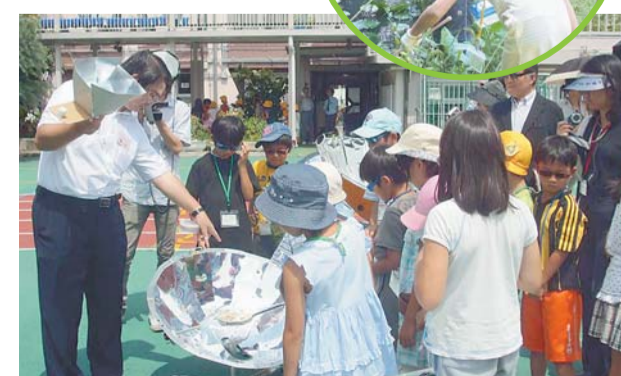
大盛況だった昨年の夏休みイベント「ソーラークッカーを作ろう」

情報コーナーには、「ごみ問題」「食」「自然」などの本・ビデオ・DVDがテーマごとにそろっていて、夏休みの宿題や自由研究の調べ物にとっても便利。地球温暖化などの環境問題が詳しく分かる展示もあり、親子で楽しく学べます。夏休みは楽しいイベントも盛りだくさん(左表)。気になるイベントに参加して、みんなで環境について考えてみよう!