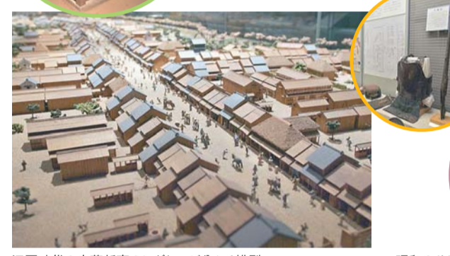
江戸時代の内藤新宿のにぎわいが見える模型 昭和のサラリーマン