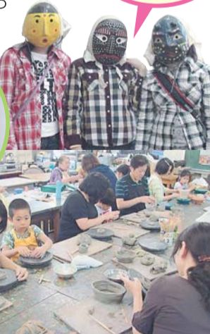
人気の「親子陶芸教室」