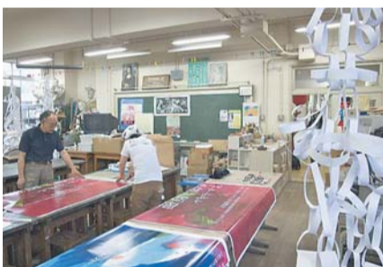
旧図工室でさまざまな講座を開催

誰もが芸術に親しめるよう、講座やギャラリーを運営しています。「こども図工室」では、大きなダンボールに絵を描いたり、額縁を自分で作ったりして、自由にのびのびと工作を楽しめます。「手で見えるギャラリー」では、造形作家の作品を展示。直接触れることができる作品の数々は、子どもたちにも好評です。