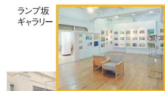
ランブ板ギャラリー