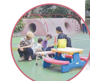
誰でも利用できる園庭。遊具も増える予定です