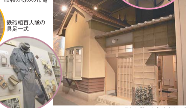
昭和の初めの市電 鉄砲組百人隊の具足一式 昭和初期の文化住宅を再現

企画展示室では、所蔵資料展「地図と絵はがきでみる新宿風景」を開催中。宿場町から新都心へと変わっていく様子を、地図や古い絵はがきで紹介しています。