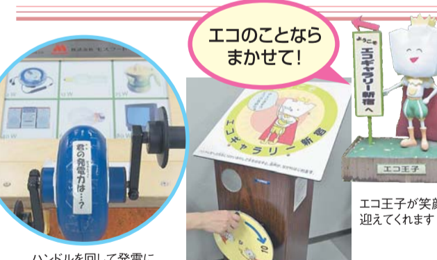
エコ王子が笑顔で迎えてくれます