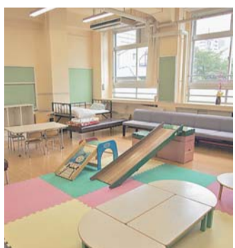
「親子のサロン」ではイベントも行います

地域の皆さんがボランティアで運営する地域のひろばです。建物には、多世代交流サロンや親子のサロン、大人のサロン、コミュニティルーム、多目的ルームなどがあり、交流の場として、地域のさまざまなサークルの集まりなどに貸し出しています。また、誰でも遊べるスペースとして、園庭を開放しています。