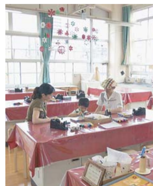
親子でおもちゃ作りに夢中

電話番号 ☎(5367) 9601 開館時間 午前10時～午後4時(入館は午後3時30分まで) 休館日 木曜日、年末年始(2月と9月に特別休館日あり) 入館料 おとな(中学生以上)700円 子ども(3歳～小学生)500円 おとなごもペア券1,000円 ホームページ http://goodtoy.org/tm/