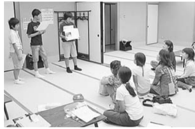
▲発表会では、これまでの活動の成果を披露します

区では、お祭りやキャンプなどの地域活動で子どもたちの中心となって活躍するジュニアリーダーを、区内在住・在学の小学