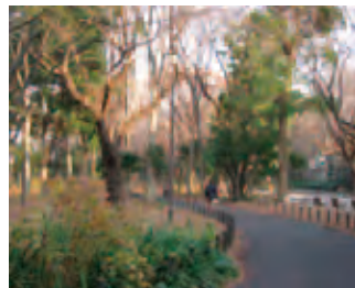
5 林の中の散歩道。日差しが優しい