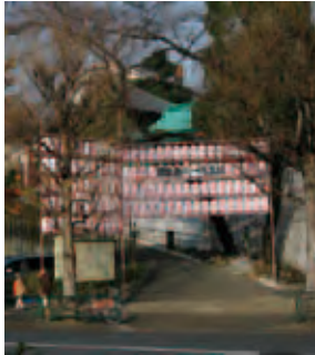
2 一陽来福の放生寺へ