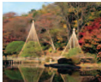
9 新江戸川公園雪支度