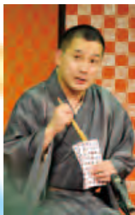
春風亭一之輔 「茶の湯」