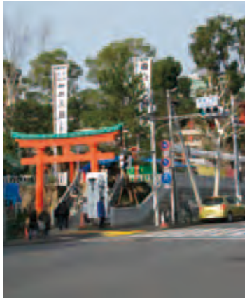
1 新装改修なった穴八幡

図中Bは都立戸山公園大久保地区と呼ばれ、早稲田大学理工学部の右側が入口で、大きく九つの広場に分かれています。老若男女を問わず楽しめるように、また公園自体を立体的に設計しており、トイレ、水飲み場は随所にあります。座る場所はありませんので敷物持参がよく、散歩にはおすすめコースです。