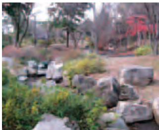
4 石組みの溪流を思わせる小川