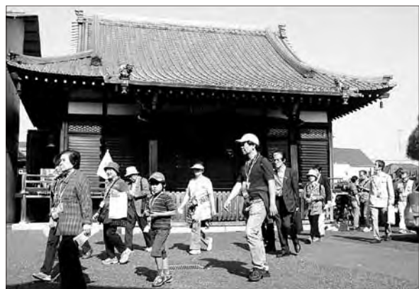
▶松井須磨子(新劇女優)吉川湊一(平家琵琶奏者)の墓がある弁天町の多間院を見学。

早稲田大学大隈講堂→大隈庭園→早稲田大学坪内博士記念演劇博物館→穴八幡宮→夏目漱石誕生の地→誓閑寺→来迎寺→感通寺→有島武郎旧居跡→林氏墓地→浄倫寺→多間院→夏目漱石終焉の地