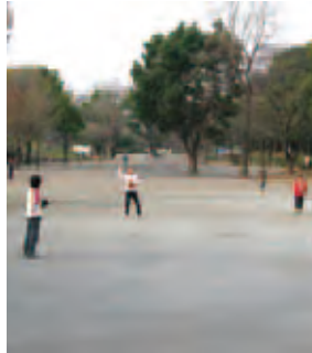
3 流鏝馬の行われる広場