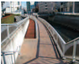
8 源水橋の近くにテラスがある。一休み