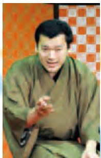
柳家小んぶ 「子ほめ」