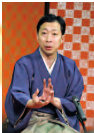
古今亭菊之丞「愛宕山」