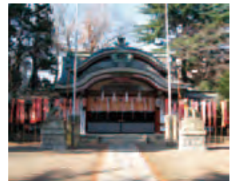
7 新年を迎える水稲荷神社