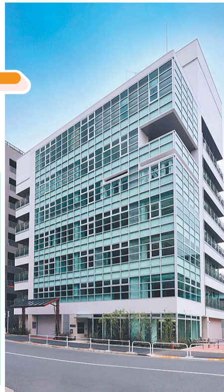
▲戸塚地域センター外観