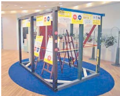
神戸市で展示された耐震改修体感モデル「ゆれゆれ君」