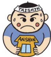
耐震くん(耐震化支援事業イメージキャラクター)