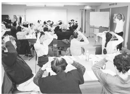
わかりやすいツボ押し・マッサージの実演とお話(10月・四谷地域センターで)

介護者の心身の負担軽減と元氣回復を目的に、講演会や介護に役立つ教室、介護者同士の交流会を開催しています。 ●高齢者を悪質商法から守ろう 被害発見のポイントと対策 【日時】1月27日(水)午後1時～3時30分 【会場】新宿げやき園(百人町4-5-1) 【対象】区内在住で現在高齢者を介護している方、介護の経験があり交流会活動に意欲のある方、30名程度 【内容】東京都消費生活専門相談員の講演と交流会 【費用】無料 【申込み】電話で戸塚高齢者総合相談センター ☎(3203)3143へ。先着順。 ※1月16日(土)に榎町地域センター(早稲田町85)で、「介護する人の健康づくり」をテーマに開催します。お申し込みは榎町高齢者総合相談センター ☎(5367)6737へ。 ●2月・3月の開催予定 申し込み方法等詳しくは、後日、広報しんじゅくでお知らせします。 ▼2月17日(水): 柏木地域センター