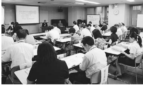
公開プレゼンテーションの様子

区では、主に行政が担ってきた公共の分野に地域の方の意欲と能力を生かし、多様な主体が地域を支える仕組みづくりを進める協働事業提案制度を実施しています。 この制度で提案があった事業を、地域の方と行政が協働で実施することで共通する課題を解決し、区民の皆さんが安心して住み続けられる地域社会の形成を目指しています。 今年度は、申請のあった14事業の提案のうち1次審査(書類選考)で選ばれた6事業について9月3日に2次審査(公開プレゼンテーション)を実施し、