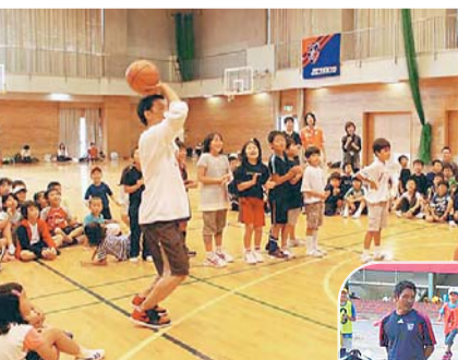
たくさんのスポーツを思う存分楽しみました

都民の日の10月1日、西戸山中学校(大久保3-1-1)で、「ゆめじぎょう～コラボレーション」を開催しました。最高峰のスポーツ・文化に触れる体験を通し、子どもたちに夢や希望を持って健やかに育ってほしいと、区教育委員会と区立小学校PTA連合会が連携して実施したものです。会場には約200名の小学生が集まり、東京ヤクルトスワローズ・FC東京・東京アパッチの元選手やコーチ等から、野球・サッカー・バスケットボール・バレーボールを教わりました。