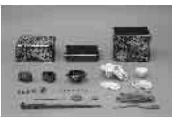
法正寺遺跡出土副葬品

【会期】7月21日(土)～10月14日(日) ※月曜休館(月曜が祝日にあたる場合はその翌日) 【会場】新宿歴史博物館 地下1階 企画展示室 【観覧料】無料