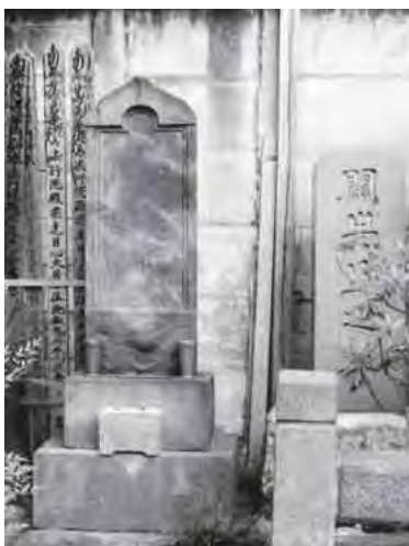
関 孝和(和算の先駆者) 生年 1637年(寛永14年) 1642年(寛永19年)の2説あり 没年 1708年(宝永5年)10月24日 浄輪寺(都指定史跡) 新宿区弁天町 95番地