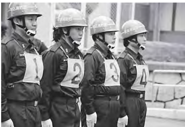
6月3日(日)「牛込消防団操法大会」に参加