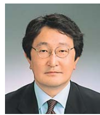
20 のづ たけし

〒161-0033 下落合3-16-15 エタニティー目白701 (3954) 3573