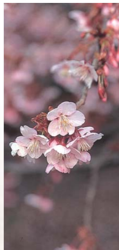
新宿御苑のコヒガンザクラ