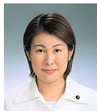
21 あざみ 民栄

〒162-0062 市谷加賀町2-6-1 市ヶ谷加賀町アパート D-302 (3260) 1456