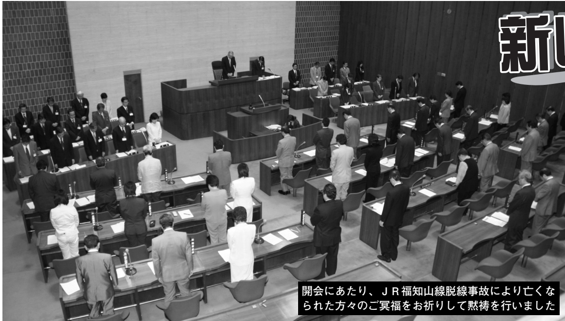
開会にあたり、J R 福知山線脱線事故により亡くなられた方々のご冥福をお祈りして黙禱を行いました