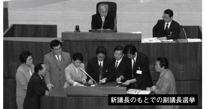
新議長のもとでの副議長選挙

5月19日、平成17年第1回臨時会が招集され、議長、副議長及び常任、議会運営、特別の各委員会委員の選任などを行い、同日閉会しました