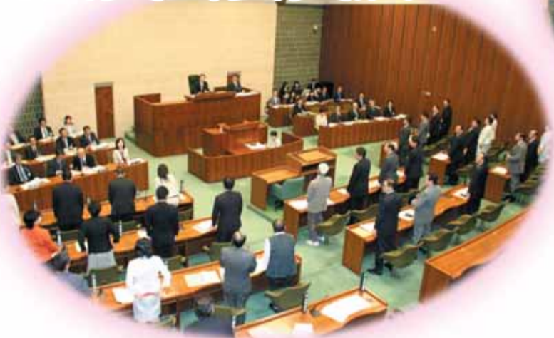
▲監査委員選任の同意