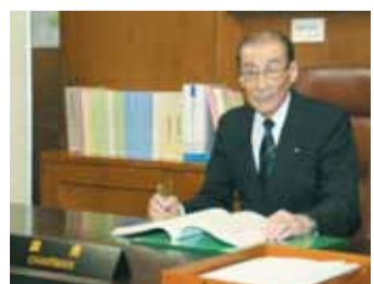
議長 深沢 としさだ