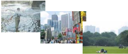
新宿区まちづくりランドデザイン 新宿まちづくり懇談会報告書