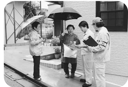
皆さんの疑問に丁寧にお答えします

分別方法や集積所に関する事など、さまざまなご相談に応じているほか、個別に資源・ごみの排出指導等を行っています。