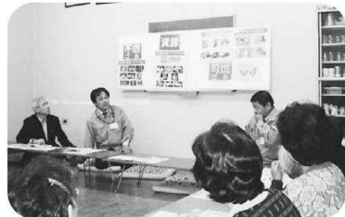
資源・ごみの実物やパネルを使って分かりやすく説明します

町会・自治会やマンションなどの集まりを対象に、資源・ごみの新しい分別方法の説明会を行っています。実施方法等のご相談に応じます。詳しくは、新宿清掃事務所へお問い合わせください。