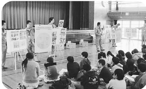
ごみの分別やリサイクルに取り組むことの大切さをやさしく説明します

小学校・保育園等で行われる環境学習に協力しています。小学校ではごみの行方の学習やごみの模型を使った分別体験を、保育園では紙芝居を使ったりリサイクルの説明などを行っています。子どものころから分別の習慣を身に付けてもらうため、積極的に取り組んでいます。