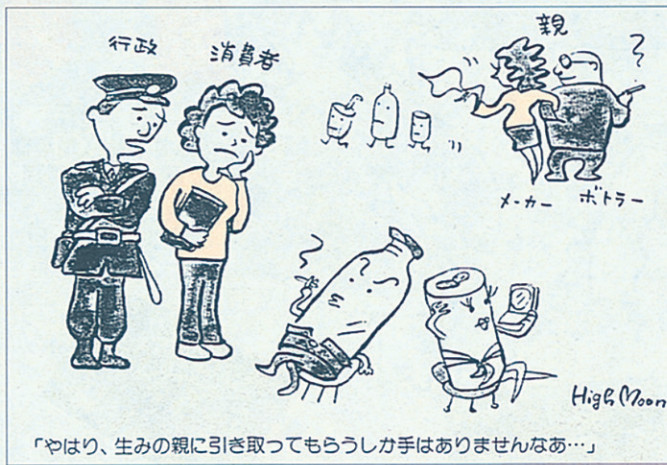
「やはり、生みの親に引き取ってもらうしか手はありませんなあ…」 (漫画ゴミック「廃棄物」VOL3高月編著朝日新聞より)

わたしがリサイクル推進員になって、いつの間にか、2年近くが経過した。任期中に幾つかのリサイクルに関連した施設を見学する機会を得た。使用済みPETボトルを処理している工場では、元の形状から想像もできないような繊維製品や車のシートに再生され、驚きや禁止しなかつた。 理地まで運ぶごみの容積を減らすための中間施設も見学した。清掃工場では、ごみ焼却熱で発電した電力を電力会社に売って地域冷暖房など、サーマルリサイクルの形で地域に還元しているが、地域住民はダイオキシンによる環境汚染を心配している。ダイオキシンは、漂白のための塩素残留量の高い紙ごみ類や塩化ビニール製品が強制焼却されるため発生すると考えられている。ダイオキシン対策では、ガス化溶融炉の設置が主力になるだろう。 リサイクル事業が曲がり角にきていると言われている。数年前までは古新聞や古雑誌を買って取った回収業者が、古紙価格の暴落により回収に来なくなった。さらに、事業所等では、金を出して持っていったらうとごみさへある。それは、再処