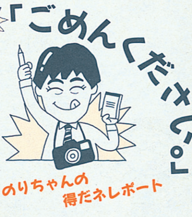
のりちゃんの得たネレポ