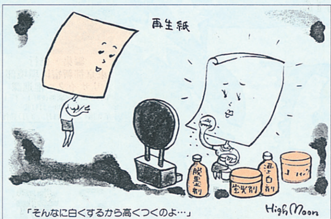
「そんなに白くするから高くつくのよ...」 (漫画ゴミック「廃棄物」VOL.3 高月結著朝日新聞より)

斜線の棒はエネルギー消費割合です。鉄道を1とすると自動車は3.5倍のエネルギーを消費し、トラックは8.7倍のエネルギーを消費します。 鉄道、つまり電車や列車に乗って出かけるのが一番地球の環境に対してよいことです。それぞれの家族が、それぞれの車で行動すると、たくさんの有害物質を出し、たくさんのエネルギーを使うのです。鉄道が最もよいことが分かりますね。大人が好きな観光地、デラックスなホテル、大勢の人が集まる有名な海水浴場のリゾート地へ行くのは子供にふさわしくありません。自然界のなりたちが学べる田舎や森へ行きましょう。」 なる程なと思いました。KUKIは小学生と幼稚園児を対象にした雑誌です。大人も知りたい知識がたくさんあって、カラーで絵もきれい。もちろん再生紙100%の紙質