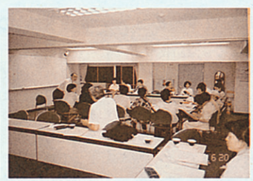
仕事帰りのメンバーもいるので、会議は午後7時頃から。熱心な議論の時間はどんどん過ぎていく。