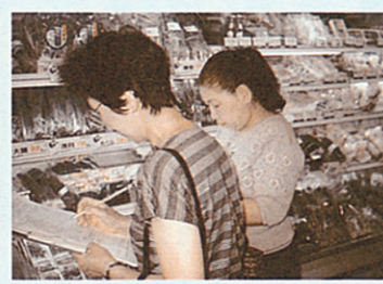
野菜や魚はバラ売り？パッケージも現物を見ながら調査。