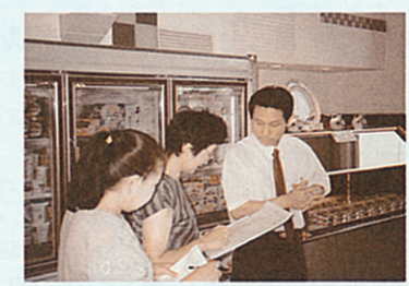
スーパーの店長さんに質問。「お店では環境にどんな配慮をされていますか？」

昨年10月にスタートした「リサイクル推進員」。メンバーはリサイクルに関心のある方。10月から半年間のリサイクルに関する育成講座を経て、今年5月から区内のスーパーやコンビニなどのお店で、生鮮食品や商品がどのように売られているか(トレー付きかバラ売りが、再生商品は売っているか)、店頭回収はしているかなどの調査活動を行いました。