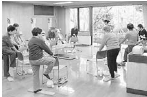
バランススティックを使った体操(清風園で)

会場…下表①②⑩⑪ 筋力・バランス能力を鍛えて、転ばない体づくりを目指します。週1回、1回1時間30分の3か月コース(1クラス12名)です。