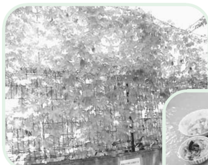
▲ゴーヤのみどりのカーテン

【メニュー(予定)】ゴーヤのちらし寿司・天ぶら・お好み焼き・ジュース・ヘチマとゴーヤのサラダ