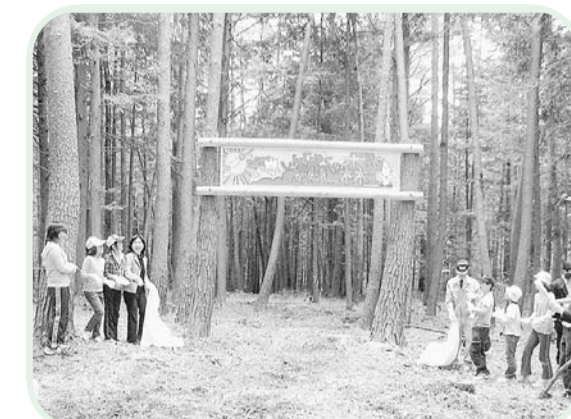
「新宿の森」の看板の除幕式

区では、長野県伊那市と「森林保全による地球環境保全のための協定」を締結しています。この協定に基づき、21年度から5年間、伊那市の市有林で、毎年約30ヘクタールずつ間伐等の整備をします。これは、区内でのCO2削減に加えて、区外の森林保全等によりCO2の吸収を促進し区内のCO2排出量から相殺(カーボンオフセット)する取り組みです。