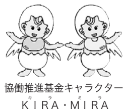
協働推進基金キャラクター KIRA・MIRA

皆さんからの寄付金を積み立てて「協働推進基金」とし、NPO法人に活動資金を助成しています。21年度は、4事業に総額145万円の助成を決定しました。寄付をしたいNPO活動の分野・団体を希望でき、皆さんの意思をできる限り尊重します。また、協働推進基金にご協力いただくと、税制上の優遇措置(寄付金控除)が受けられます。詳しくは、地域調整課管理係(本庁舎1階) ☎(5273)3872へお問い合わせください。