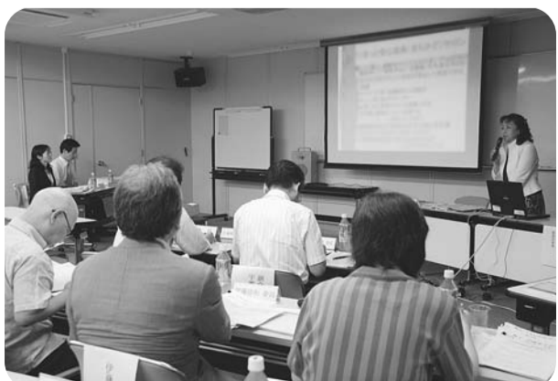
20年度公開プレゼンテーションの様子