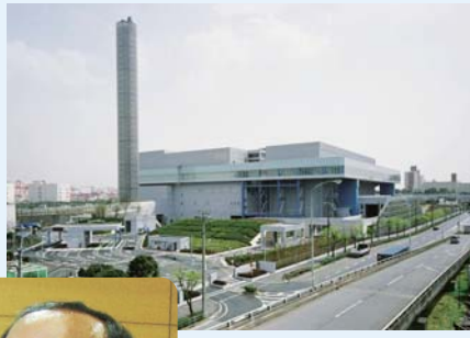
新宿区の可燃ごみを処理している清掃工場のひとつ 品川清掃工場

プラスチックを含む新しい可燃ごみの処理について、実証確認を行い、測定結果を検証しながら、本格実施に備えています。