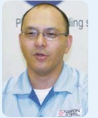
新日鐵(株)君津製鐵所 環境資源エネルギー部 グループリーター

新宿区から引き受けた容器包装プラスチックは、コークス20%、炭化水素油40%、コークス炉ガス40%に再生しています。例えば、炭化水素油は化成工場でプラスチック容器や塗料、テニスラケットのカーボン繊維原料などに生まれ変わります。