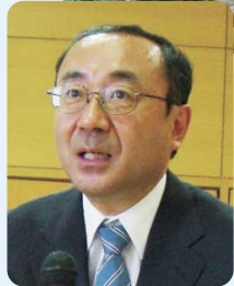
品川清掃工場 副工場長