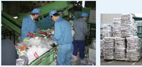
選別作業(左)と圧縮・梱包された容器包装プラスチック(右)

生ごみ、弁当などの食べ残し、紙くず、衣類、くつ、おもちゃ、CD、PPバンド(結束ひも)、びん、缶、ペットボトルなど