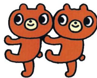
ふらっと新宿イメージキャラクター