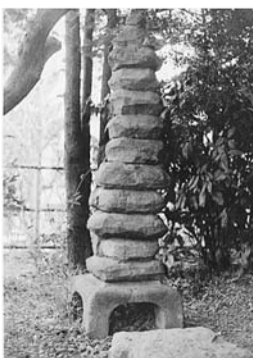
昭和28年当時の猫塚

昭和28年、激石山房跡に猫塚を復元したときの様子を写した貴重なフィルムが、新宿歴史博物館で見つかりました。