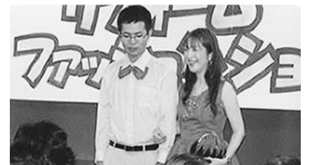
ペットボトルの再生布で制作したドレス(昨年のリフォーム・ファッション・ショーから)