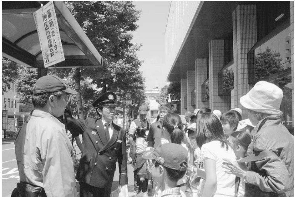
▲5月12日、筆筒地区協議会安全・安心分科会が企画した防災まち歩きで、18年度に作成した「お家で話そう防災マップ」を見ながら災害時の避難所などを確認。

※全会場で託児を用意しています。希望する方は、事前に区政情報課広報係へ申し込んでください。また、6月23日(土)・26日(火)は手話通訳を予定しています。