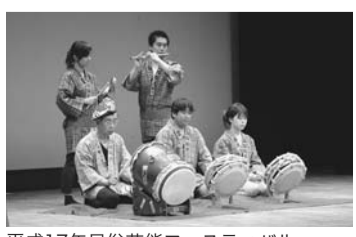
平成17年民俗芸能フェスティバル