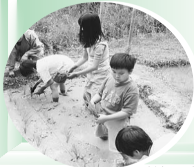
新宿で田植え体験