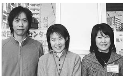
原町ホーム地域包括支援センターの職員の方

【問合せ】原町ホーム地域包括支援センター(原町3-84) ☎(5367)6737へ。