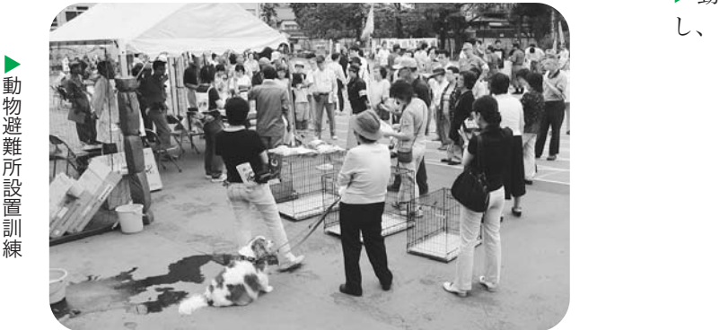
動物避難所設置訓練

人に教わる得(とく)ベツエクサイズ、12月24日(水)：これぞ安心！お正月太りも撃退！①③⑤は午後1時30分〜3時30分、②は午後2時〜3時に元氣館(戸山3-18-1)で。 【対象】区内在住の65歳未満で、運動制限がなく全15日参加できる方、30名 【申込み】電話で落合保健センターへ。先着順。