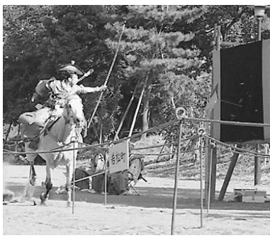
高田馬場流鏑馬の公開

享保13(1728)年、8代将軍徳川吉宗が、世継ぎの病氣治癒を祈願して穴八幡宮に奉納したことを起源とする「高田馬場流鏑馬」は、区無形民俗文化財に