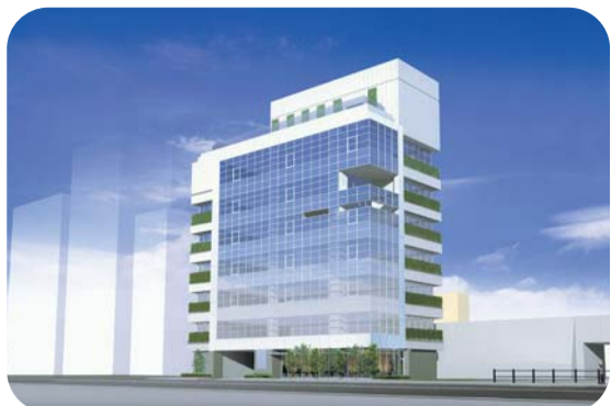
(仮称)戸塚地域センター(高田馬場2-18・地上8階・地下1階・延床面積2,994㎡)の完成イメージ図