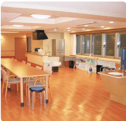
自然光を取り入れた明るいユニット内の共同生活スペース

新宿けやき園は、介護が必要な高齢者の方を対象とした「特別養護老人ホーム」と、障害者の方を対象とした「障害者入所支援施設」との複合施設です。 特別養護老人ホームは、入所する方へ、施設サービス計画に基づいて、入浴・排せつ・食事等の介護や日常生活・機能訓練・健康管理等の生活支援を行います。 障害者入所支援施設は、区内では初めての入所支援施設です。「個人」としての生活の場やご家族や友人とのコミュニケーションの場を大切にしたい「個別支援」「社会参加支援」「自立支援」を行います。 ▼建物等の概要 【所在地】百人町4-5-1 【構造等】鉄筋コンクリート造、地上6階 【運営】社会福祉法人邦友会(公募により選定)