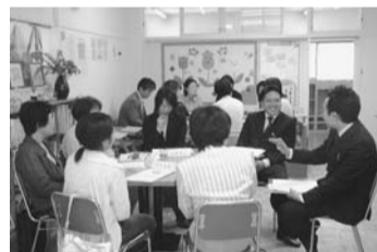
19年度の実施事業「子育て支援者養成講座」(ゆったりーの)の様子

1事業当たり500万円が上限(おむね100万円以上)。事業の実施に当たり区が負担する経費および消費税等を含みます。