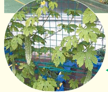
▲アサガオのカーテン (大久保小学校) ◀ツルを伸ばしたゴーヤ (西戸山小学校)

今回、ご自宅の窓辺に「みどりのカーテン」をつくっていただける方、千世帯を募集します。説明会に参加した方には、当日、ゴーヤの苗をお配りします。また、後日、プランター・土・ネットをお届けします。