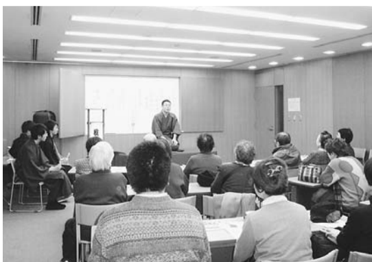
19年度助成事業「新春を落語で楽しむ会」(NPO法人東京山の手まごころサービス)

●区民・事業者の皆さんへ 皆さんからの寄附金を積み立てて「協働推進基金」とし、NPO法人の活動資金を助成しています。寄附金の額に制限はありません。また、皆さんの意思をできる限り尊重し、寄附をしたいNPO活動の分野・団体を希望できます。ご理解とご協力をお願いいたします。 【寄附の方法】電話で寄附申出書を地域調整課管理係へ請求してください。申出書は同課特別出張所でも配布しています。寄附金は直接窓口にお持ちいただくか、振り込みで受け付けます。 ※協働推進基金にご協力いただく場合、税制上の優遇措置が受けられま