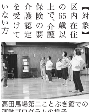
高田馬場第二ことぶき館での運動プログラムの様子