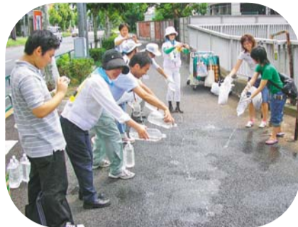
▲20年度は3,500名の方が参加

まちの大部分がコンクリートやアスファルトでつくられている新宿では、昼間にたまった熱で、夜になっても気温が下がりにくくなっています。熱くなったコンクリートやアスファルトの温度を少しでも下げられるため、地域で打ち水をしていただける方を募集します。 参加者の方は、新宿区ホームページで、登録順にご紹介していきます(事業者・団体は名のみ)。 ※「新宿打ち水大作戦」のステッカー(左図)を同課・環境学習情報センター・新宿リサイクル活動センター・特別出張所で配布しています。か、のぼりを同課で貸し出しています。ご利用ください。 273) 4267・☎(5273) 4070へ。実施計画書は、同課・環境学習情報センター(西新宿2-11-4、エコギャラリー新宿2階)・新宿リサイクル活動センター(高田馬場4-10-17)・特別出張所で配布しています。また、同課のホームページからも申し込みます。 ※「新宿打ち水大作戦」のステッカー(左図)を同課・環境学習情報センター・新宿リサイクル活動センター・特別出張所で配布しているほか、のぼりを同課で貸し出しています。ご利用ください。