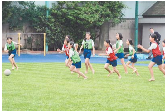
「きれいな校庭になってうれしいな」▲▲