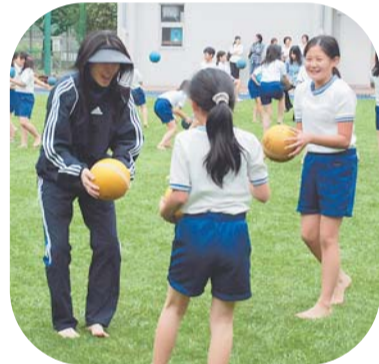
▲野田朱美さんの熱心な指導

6月1日、四谷第六小学校(大京町30)で、校庭の芝生化記念オープンングセレモニーを開催。 校庭の芝生化は、子どもたちの遊びを多様なものとし、緑を大切にする気持ちを育む環境教育にも役立ちます。 新しい芝生の上で5・6年生が演奏を披露したり、全児童が思い思いに遊びました。 また、元サッカー日本女子代表の野田朱美さんが、5・6年生にサッカーを直接指導。みんな裸足になって、ミニゲームを楽しみました。 【問合せ】教育施設課施設係(本庁舎4階) ☎(5273)3106へ。