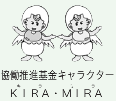
協働推進基金キャラクター KIRA・MIRA

皆さんからの寄付で運営する基金から、区内で活躍するNPOに活動資金を助成しています。 1次書類選考で選ばれたNPO法人(11団体)が、助成申請をした事業のプレゼンテーションを行います。 【日時】5月20日(水)午後1時～4時50分 【会場】申込み・傍聴を希望する方は当日直接、若松地域センター(若松町12-6)へ。先着30名。 【問合せ】地域調整課管理係(本庁舎1階) ☎(5273)3872へ。