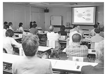
昨年の協働事業提案2次審査(公開プレゼンテーション)の様子

【日時・会場】▼①5月22日(金)午前10時～12時：区役所本庁舎3階302会議室、▼②25日(月)午前10時～12時：区役所本庁舎3階301会議室、▼③26日(火)午後6時～8時：区役所本庁舎3階301会議室(すべて同じ内容) 【申込み】電話かファックス(団体名・人数を記入)で地域調整課管理係(本庁舎1階) ☎(5273)3872・☎(3209)7455へ。