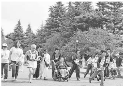
障害者と健常者がたすきをつなぎます。20年度助成事業「ピポ・ユニバーサル駅伝」(NPO法人コミュニケーション・スクエア21)

※税制上の優遇措置…21年度から、「ふるさと納税制度」により個人住民税の寄附金税制が大幅に改正されました。寄附金のうち5,000円を超える部分について、個人住民税所得割の額のおおむね1割を上限として、税額から控除されるようになりました。詳しくは、地域調整課管理係へお問い合わせください。