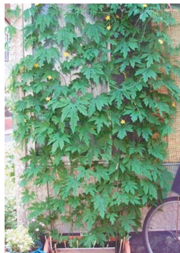
ゴーヤで作ったみどりのカーテン

「みどりのカーテン」とは、ゴーヤ等のツル性の植物を窓の外にはわせて日差しを和らげる自然のカーテンです。室温の上昇を抑えて、夏場の冷房の使用を抑制し、二酸化炭素を削減することで地球環境の保全につなげます。昨年、区のプロジェクトに参加した方からは、「ゴーヤを通して近所との会話が増えた」という声が多く寄せられています。